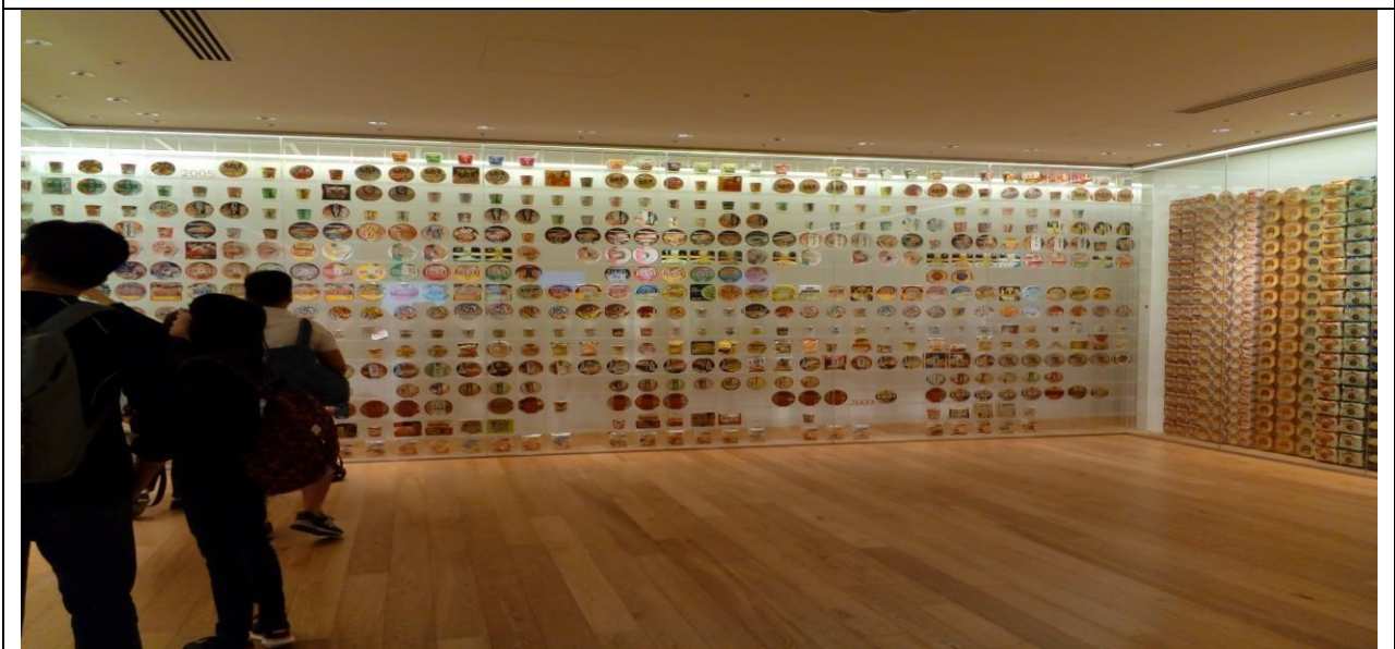
說明：參觀杯麵博物館2樓的展示廳，擺飾著來不同年代的泡麵及各國泡麵。(106/05/31)