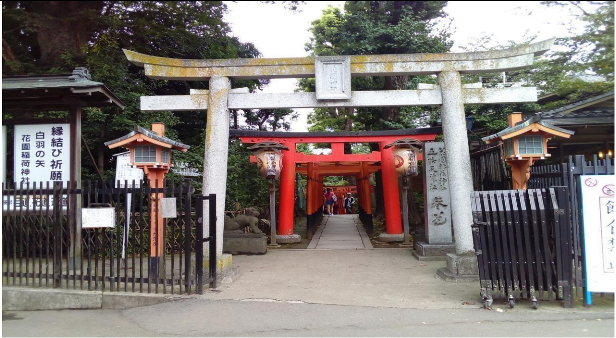
説明：参拜花園稲荷神社。(106/08/18)