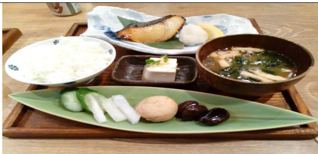
說明：主管們一起吃中餐。(106/05/30)