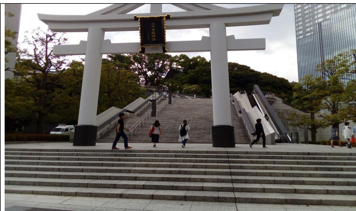
說明：參拜日枝神社，祈求工作一切順利。(106/06/02)