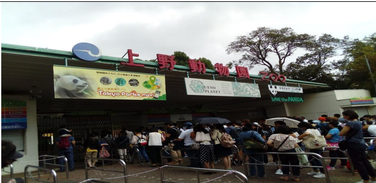
説明：去上野動物園。(106/08/18)