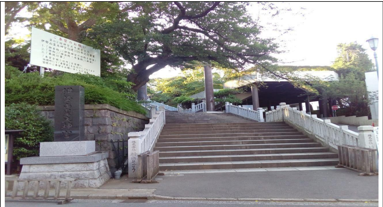
説明：去伊勢大皇宮参拜。(106/07/11)