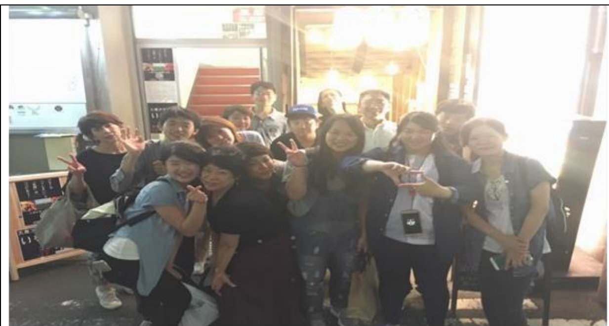
說明：跟部門同事一起吃飯。(106/08/30)