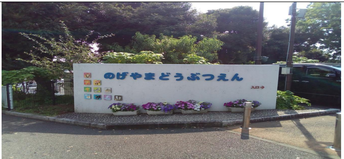
説明：去野毛山動物園。(106/06/20)