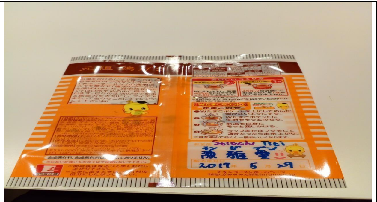
說明：自己動手做麵，從麵粉到麵條整個過程都是自己完成。(106/05/31)