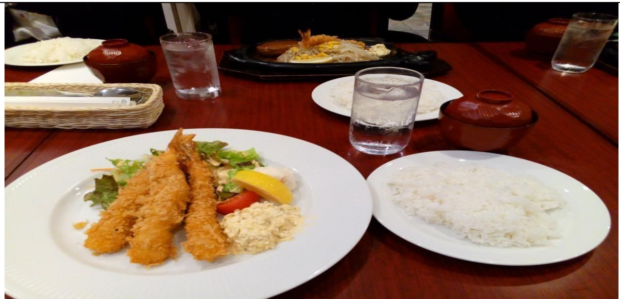
說明：入社式完後，與主管們一起享用中餐。(106/06/02)