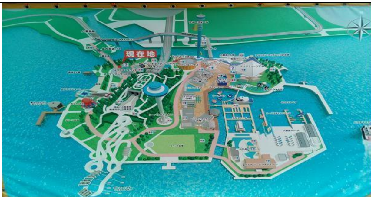
說明：去八景島的海生館玩，這是園區地圖。(106/04/02)