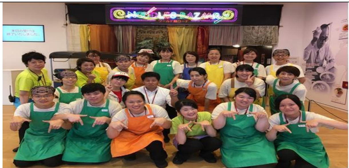
說明：跟部門的同事們☺ 身上的是我們的制服。(106/08/28)