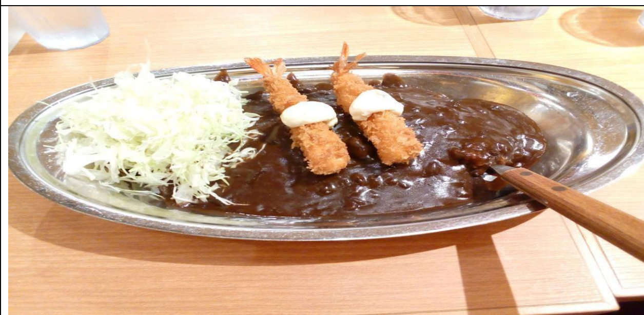
說明：ゴーゴーカレー在日本最常吃的。(106/06/11)