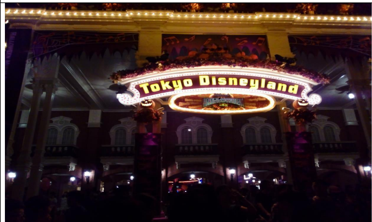
說明：去東京迪士尼。(106/09/12)