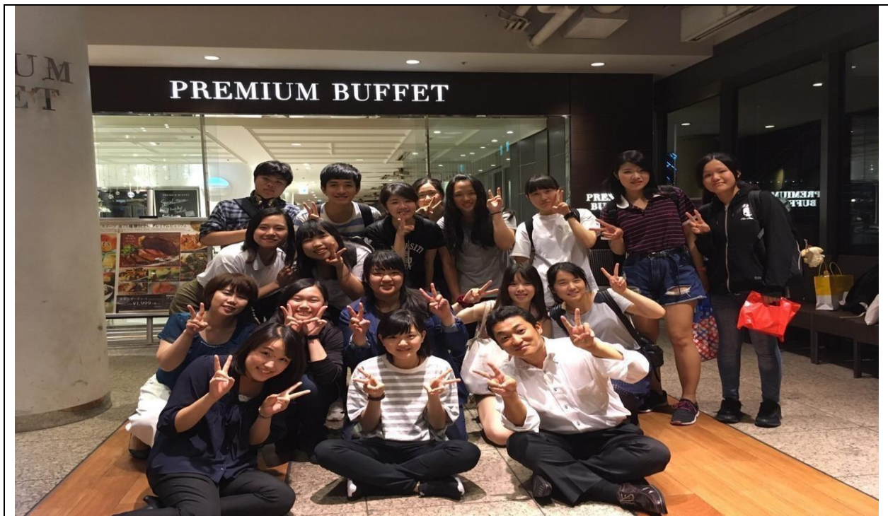
說明：大家與主管一起聚的餐。(106/08/25)