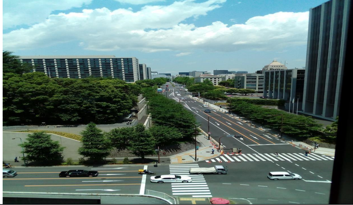
說明：從總公司拍出去的外景。(106/06/02)