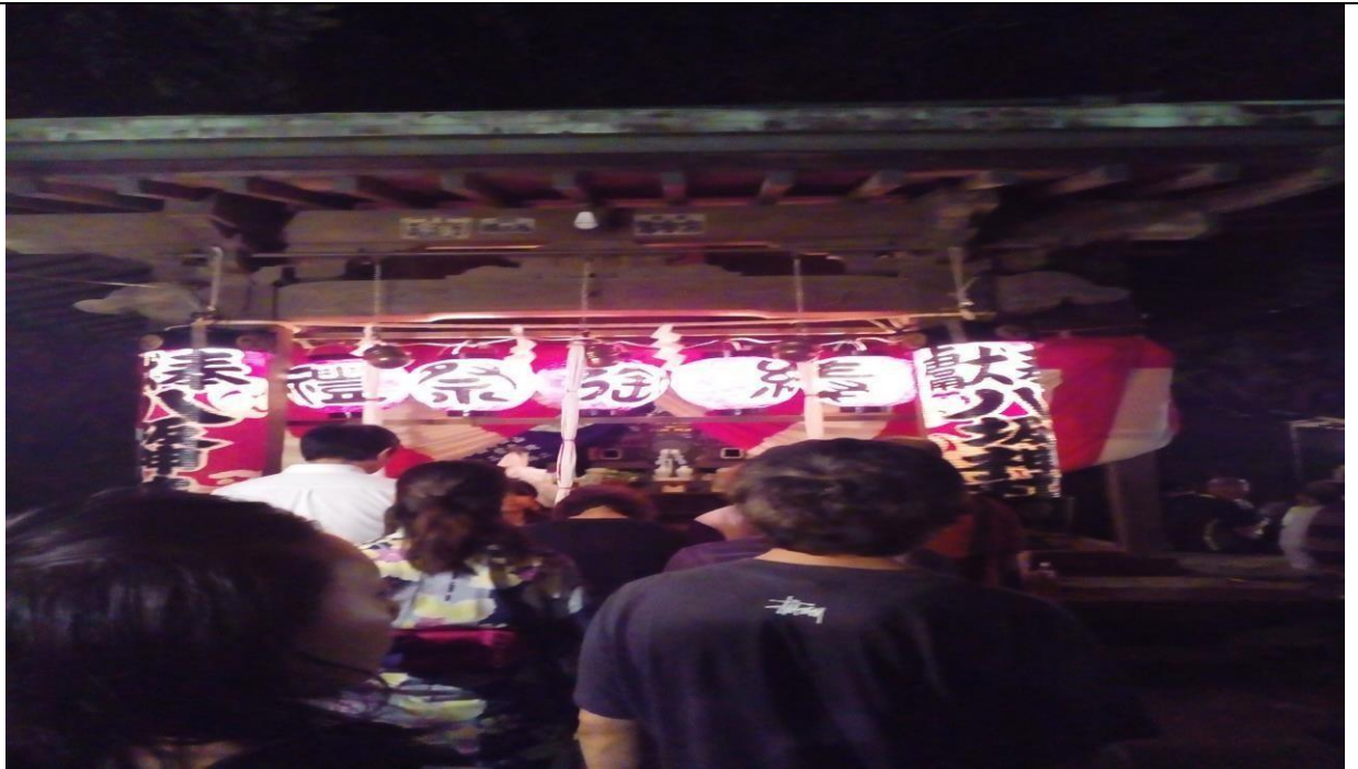
說明：參拜戶塚的八坂神社。(106/07/14)