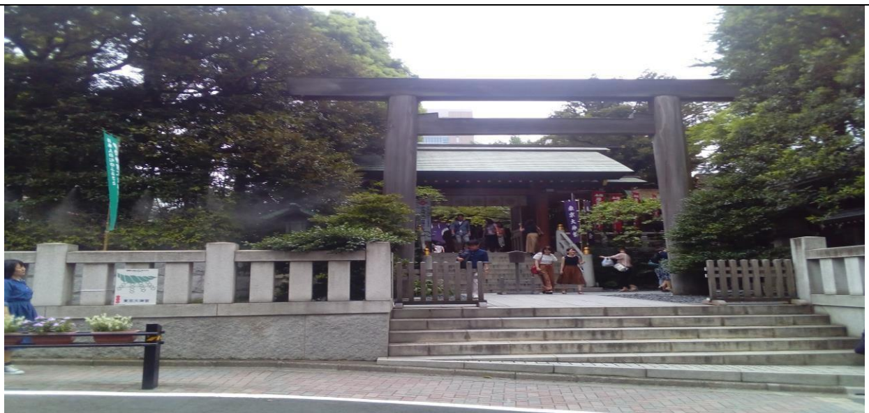
説明：参拜東京大神宮。(106/08/19)