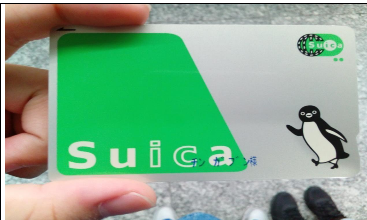
說明：スイカ似台灣卡通，都用這個坐電車通勤（106/05/26）