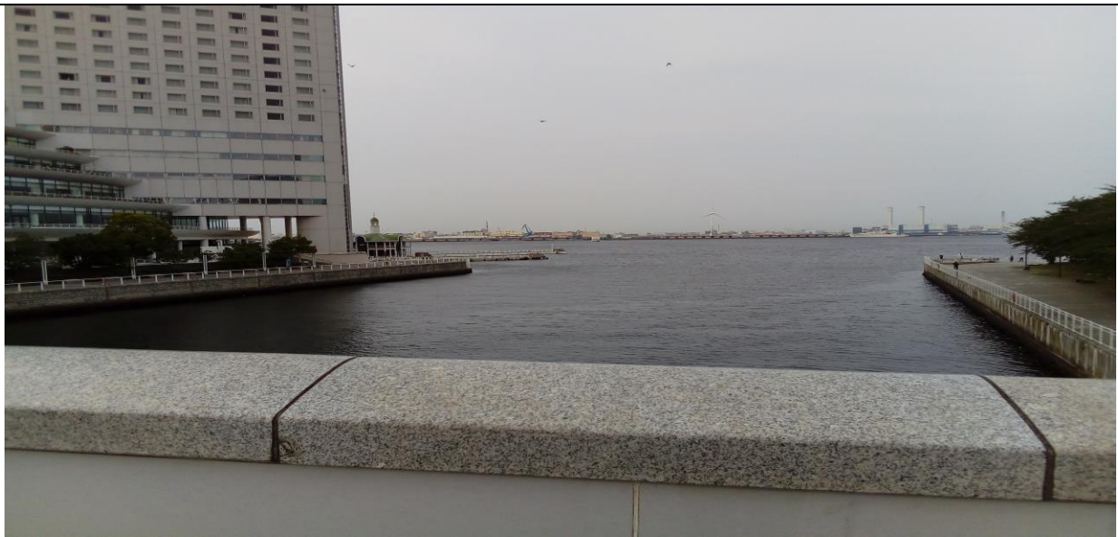
說明：橫濱港，就在公司旁邊而已，每天上班都是看著這片海。(106/05/31)