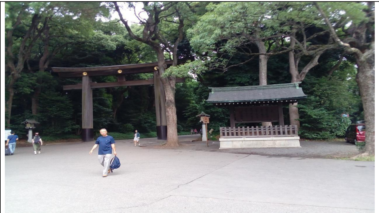
說明：去明治神宮參拜。(106/06/27)