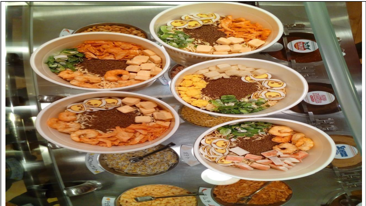
說明：參觀博物館，大家一起畫屬於自己的杯麵，選擇自己喜歡的口味。(106/05/31)