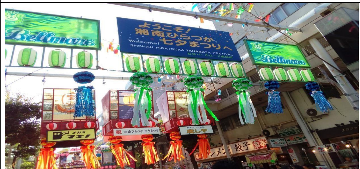
說明：參加日本的七夕祭典。(106/07/07)