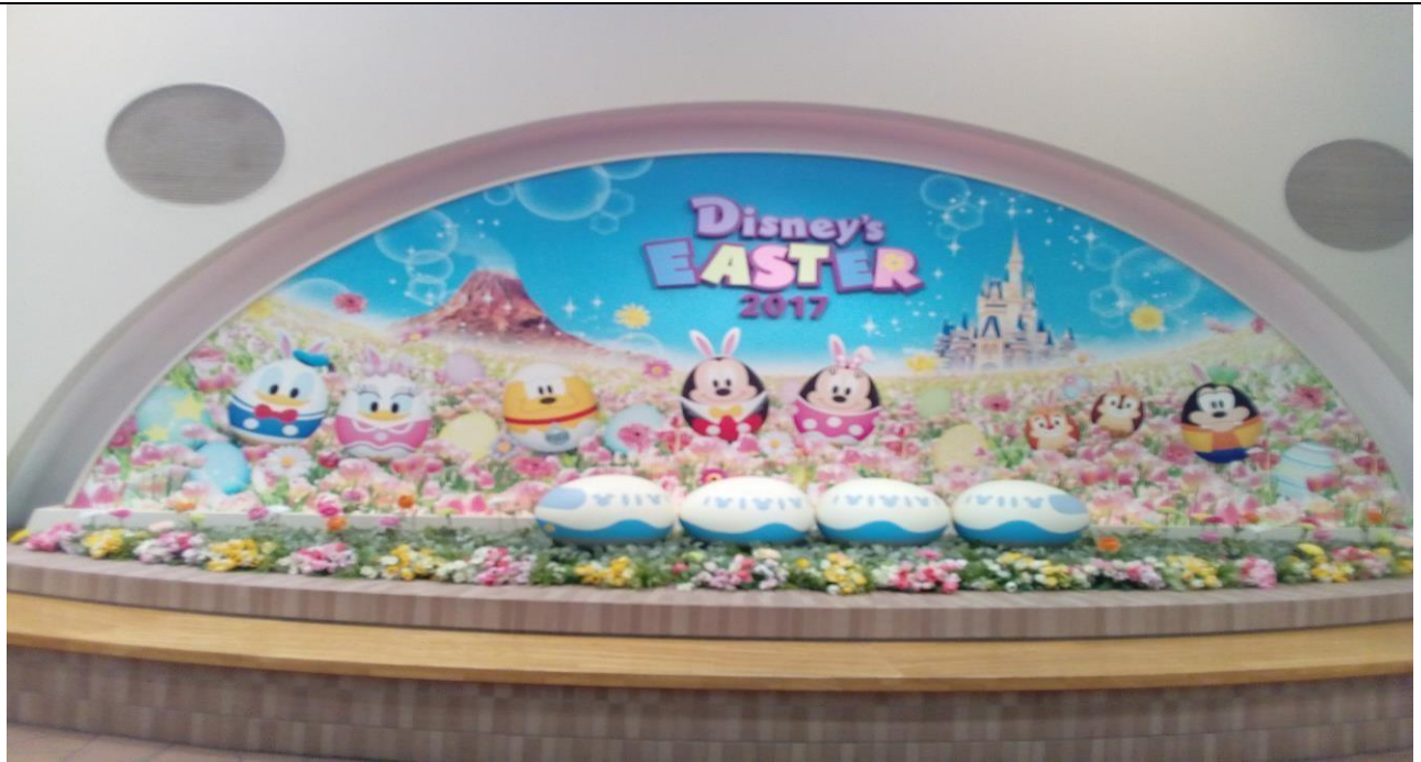
説明：去迪士尼海洋。(106/06/13)