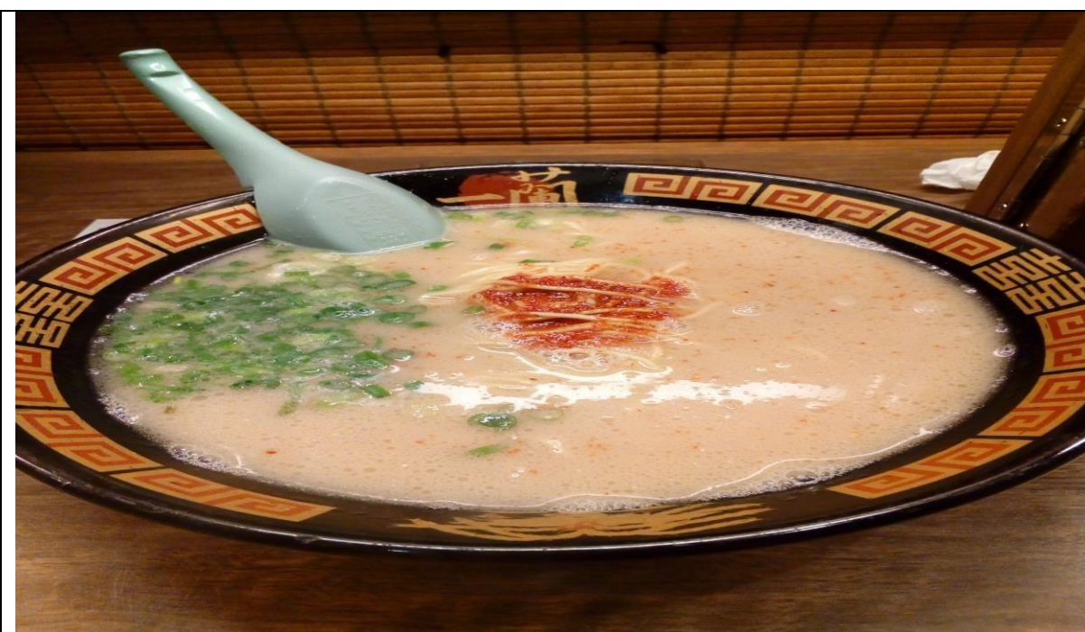
說明：第一次吃一蘭拉麵。(106/07/17)