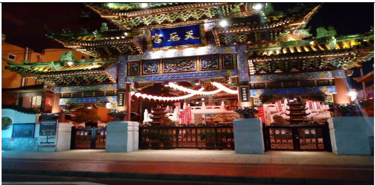
說明：去中華街玩，這是中華街裡的馬祖廟。(106/07/17)