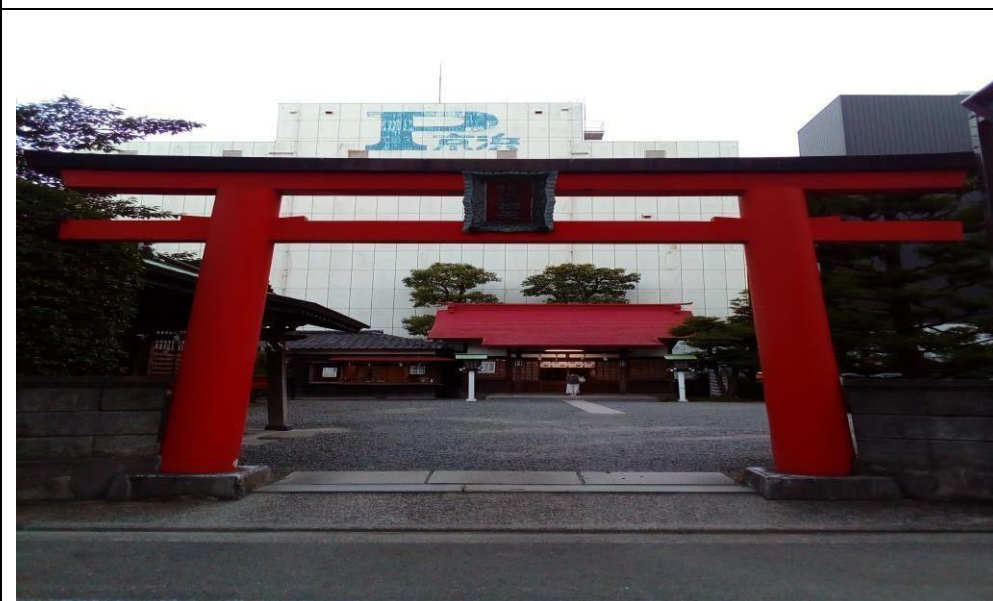
説明：去横濱辯天神社参拜。(106/07/11)